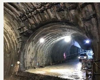
高高ボルトによる交差部補強事例