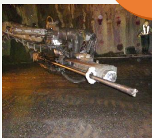
ドリルジャンボへの高高ボルト搭載状況