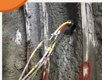
チューブ式インサートシステムによる2ステップ注入